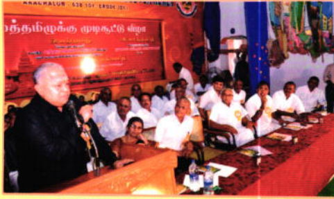
Muthamilukku mudi sootu vizha Special Address by Raadha Ravi Cine Actor Chennai