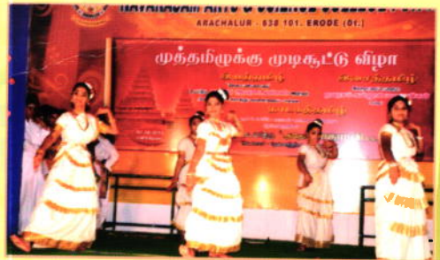
Fine Arts students staging the performance of Mohini Attam