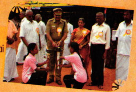
"Awareness Rally" on "Save Forest" by our students