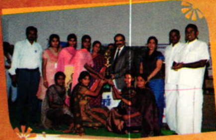
Women's Day Celebration